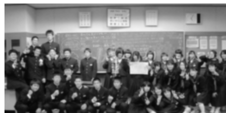
よりよい生活はよりよい集団から生まれるものである

集団の中で、現在及び将来の自己の生活の課題を発見し、よりよく改善しようとする視点。自己の理解を深め、個々人が共通して当面する現在及び将来に関わる課題を考察する中で自己のよさや可能性を生かす力、自己の在り方や生き方を考え設計する力などの自己実現に必要な資質・能力を育む。