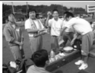
生徒会の行事が自主的に行われるかどうかは事前指導が決まる