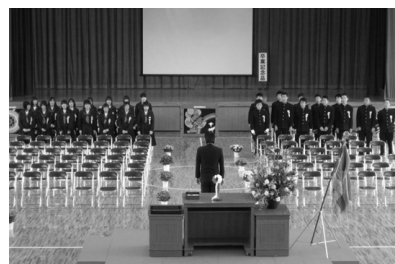
卒業式後の学級・ホームルーム活動は、教室で全員が集まる最後の時間となる