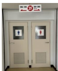
各階のトイレ入口