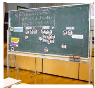
図3 黒板に自分の意見を示す