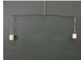
図1 つりあっているてんびん

一般的な授業の展開では、片方のうでが曲がるような実験は取り扱わないですが、全国学力学習状況調査などの出題傾向にある、既知の事柄から未知の事柄を明らかにする発展問題として取り組ませます。