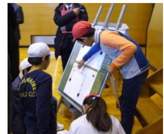
図4 友達と意見を交流する。

てこの規則性である「支点からの距離」×「重さ」で両側がつり合うことに最終的に迫っていけるように、話し合う時間を設けます。既習の内容を掲示しておいたり、話し合いに使える図を置いたりします。それぞれの選んだ予想別に紅白帽子の色を分けて、お互いの意見を交流させます。友達と話し合う中で意見が変わった児童は、黒板のマグネットと帽子の色を変えてさらに意見を交流します。(図4)