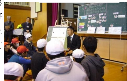
図5 話し合った意見を全体で交流する。

最後に全員で黒板の前に集まり、練り合った意見を全体で話し合います。予想としての根拠を明らかにして、お互いに主張をさせます。教師は答えに関わらずに、コーディネイト役をします。この際、児童が経験や既習内容から自分の意見を持つことを重視しているため、全員が答えにたどり着かなくてもいいこととします。次時に実験をして、結果を知ってから考察をするので、自分の意見をノートに記入させます。(図5)