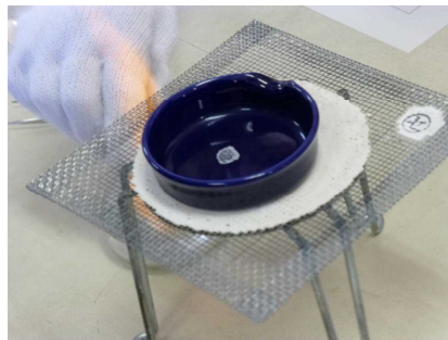
蒸発させてみたら…