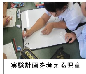
実験計画を考える児童

初めに個人で実験計画を付箋に書き込み、それを持ち寄ってグループで実験計画をホワイトボードに書き込んだ。グループで計画を立てる際には「その実験を行うことで何が分かるのか」も実験計画に書き込ませ、実験計画が妥当なものであるかを話し合わせた。