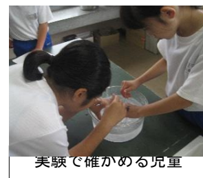
実験で確かめる児童

グループ毎に実験計画に従って実験を行った。蒸発・冷却の順序はどちらを先に行っても同じ実験結果が得られる。（食塩水の濃度、氷水の温度によっては、食塩が少量析出したり水が凍ったりする場合がある。）